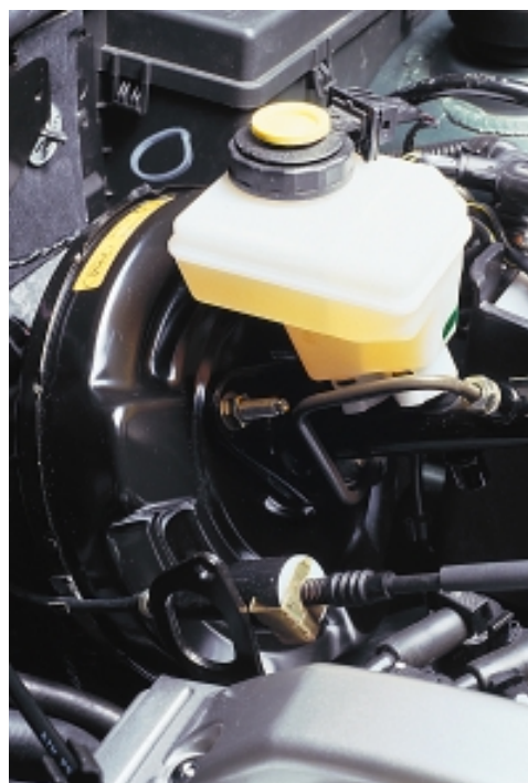
La presión de frenado se genera en la bomba de frenos

Los discos de freno pueden ser macizos o ventilados . Los ventilados son dos discos unidos entre sí por tabiques metálicos, que, cuando giran, crean un efecto ventilador, que refrigera el disco más rápidamente. Este tipo de discos se suele montar en el eje delantero, que está sometido a mucha más carga que el trasero durante las frenadas.