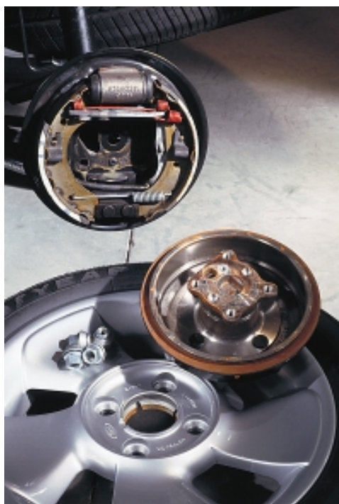
Freno de tambor

En los frenos de tambor, la pieza que gira solidaria con la rueda es un tambor de hierro fundido; en su interior se encuentran dos zapatas en forma de semicircunferencia, en cuya cara exterior se ha dispuesto el material de fricción. Al pisar el freno, un pistón separa las zapatas y las empuja contra el tambor, generando la fricción que detiene el coche. Los frenos de tambor tienen la desventaja de que, al estar los elementos encerrados en el tambor, disipan con dificultad la gran cantidad de calor que se genera durante la frenada. Su mayor peso también es un inconveniente cuando se efectúa su montaje en el eje delantero, ya que influye negativamente en el trabajo de la suspensión. No obstante, tienen la ventaja de que la superficie de contacto entre el tambor y las zapatas es mayor que entre el disco y las pastillas. Dado que el eje delantero es el que soporta mayor esfuerzo durante una frenada, quedando el eje trasero muy aligerado, Ford dispone, en todos sus nuevos vehículos, frenos de disco en el eje delantero y de tambor en el trasero, aunque en los modelos que poseen mayor peso y prestaciones la disposición es de frenos de disco en ambos ejes.