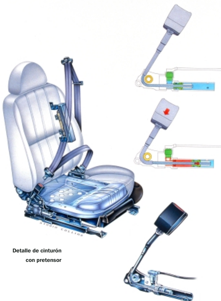
Detalle de cinturón con pretensor

Un refinamiento más lo constituyen los llamados sistemas de sujeción programada , en los que el carrete del cinturón está fijado a una chapa que se deforma por la fuerza ejercida por el cuerpo del ocupante contra el cinturón y absorbe parte de la energía, reduciendo la presión sobre el pecho durante el golpe. En los modelos Ford, este efecto se consigue con una barra de torsión, dispuesta en el carrete del cinturón.